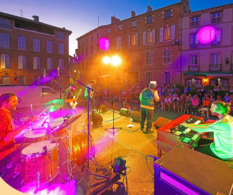
Place du Palais