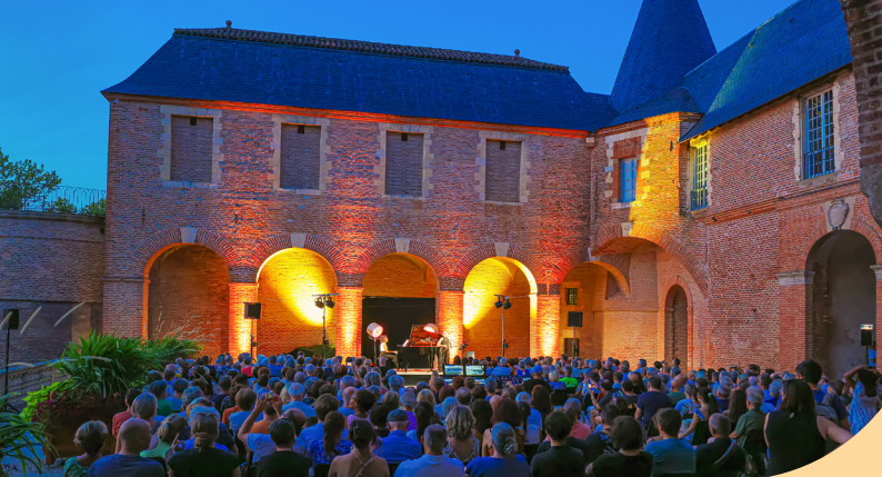
Palais de la Berbie